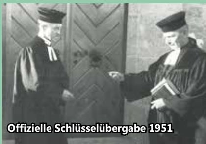
Offizielle Schlüsselübergabe 1951

... class unsere Kirche dieses Jahr 75 Jahre alt wird? Zu diesem Anlass haben wir zwei Veranstaltungen geplant: Einen Festgottesdienst zur Kirchweih am 01.11.2026 und ein Konzert mit der Band „Starke Worte“ am 21.11.2026. Genaue Infos gibt es dann im nächsten Gemeindebrief.