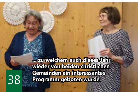
... zu welchem auch dieses Jahr wieder von beiden christlichen Gemeinden ein interessantes Programm geboten wurde.