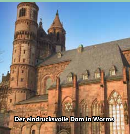
Der eindrucksvolle Dom in Worms

... class noch Plätze in der Reisegruppe der Gemeindefahrt frei sind? Am Wochenende des 27./28. Juni 2026 werden die beiden Lutherstädte Worms und Heidelberg besucht, wo der Reformator Spuren hinterlassen hat. Anmeldungen liegen in der Kirche aus und sind im Pfarramt und bei Yvonne Haundel erhältlich. Zögern Sie nicht, der Anmeldeschluss ist bereits der 05.06.!