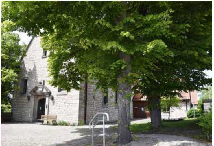
Christuskirche im Sommer

Konfirmation Kindertagesstätte besondere Gottesdienste Umbaupläne Gemeindehaus